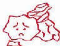
再生の出来ない紙くず