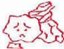
再生の出来ない紙くず