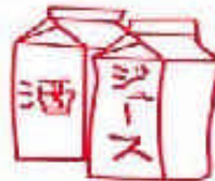
アルミニウムが貼ってあるパック類