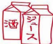
アルミニウムが使ってあるバック類