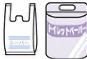
レジ袋・日用品などの袋