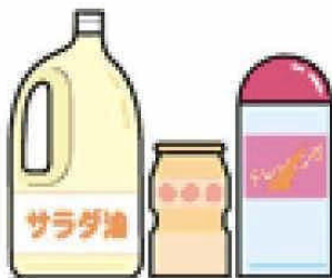
食用油・たれ・ドレッシングなどの容器