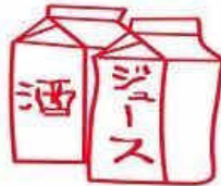
アルミニウムが使ってあるバック類