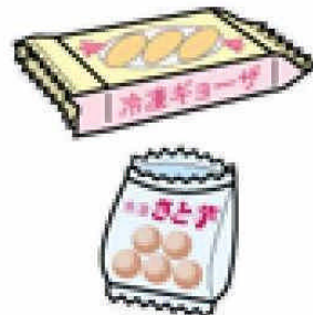
インスタント食品・冷凍食品などの袋