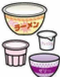
カップめん・プリンゼリーなどのカップ