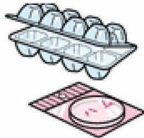
卵のパック・果物・ハムなどのパック