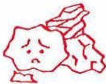
再生のきかない紙くず