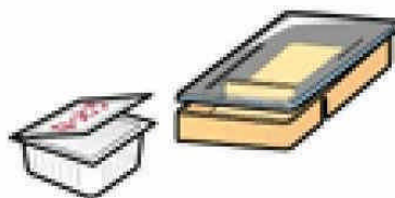
コンビニ弁当・納豆腐などの容器