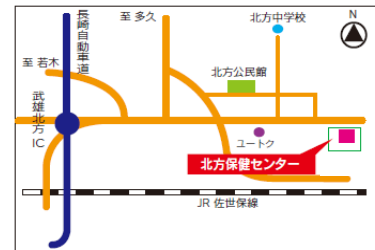
北方保健センター