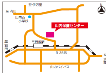
山内保健センター