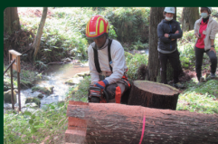
林業事業者による伐倒の実演