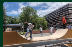
スケートボードセクションの制作