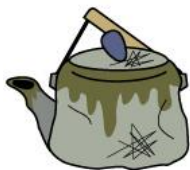
nồi/ ấm đun nước