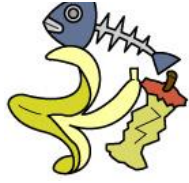
rác sinh hoạt