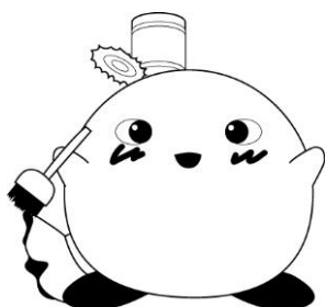
Nhân vật bảo vệ môi trường thành phố Takeo Kurin- chăng

※đảm bảo sử dụng hết bình ga và bình xịt trước khi xử lí