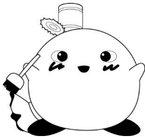
Nhân vật bảo vệ môi trường thành phố Takeo Kurin- chăng