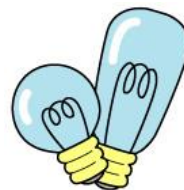
bóng đèn trắng