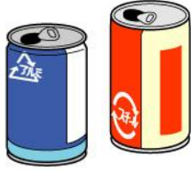
lon nước uống