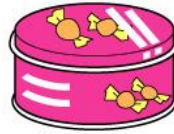
hộp thực phẩm

※Bỏ những thứ không thể làm sạch hoặc bình xịt vào túi rác không đốt được