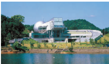
佐賀県立宇宙科学館

宇宙と科学をテーマとする科学館。 プラネタリウムや天文台があり、 様々な体験ができる。