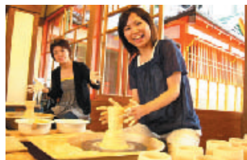
竹古場キルンの森・飛龍窯 世界一の登り窯「飛龍窯」と、工房 や展示室がある。市内には40余りの 窯元があり、陶芸体験が可能な施設 もある。