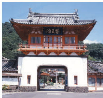
武雄温泉・楼門 (国指定重要文化財) 宮本武蔵やシーボルトなど歴史の人物も 入ったと伝えられる古湯。