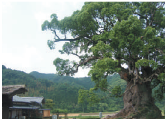
川古の大楠 (国の天然記念物)

樹齢3000年を超える全国第5位の巨木。 市内には他に全国第7位の「武雄の大楠」 がある。