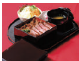
佐賀牛や若楠ポークなどの 食の体験もお楽しみに!!