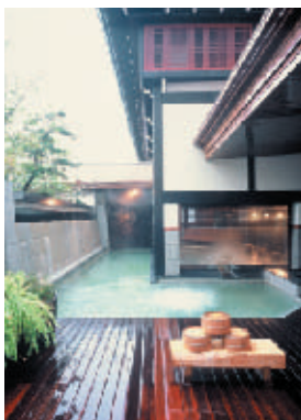
市内旅館の露天風呂