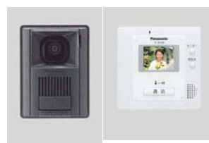
▲カラーモニター付 ドアホン