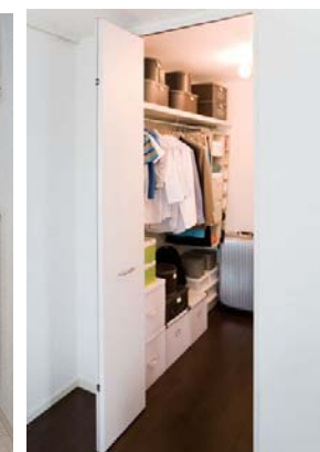
▲ウォークイン クローゼット