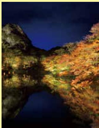
▲四季折々の景観が美しい御船山楽園