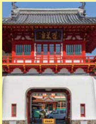
▲武雄市のシンボル武雄温泉楼門

武雄市は佐賀県の西部にある人口約5万人の温泉都市で、1,300年の歴史を誇る美人の湯「武雄温泉」や樹齢3,000年の武雄の大楠など見所が多く、今、国内外から続々と観光客にお越しいただく話題のスポット。温泉旅館もごございます。市民一同、みなさまのお越しをお待ちしています。