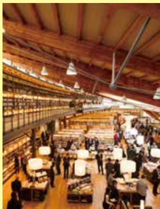
▲県外からの来館者も多い 武雄市図書館・歴史資料館