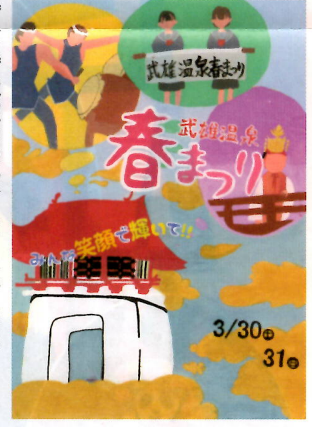
《入賞》武雄中学校2年 土谷 未来さん

フリーマーケット・さくら市 フリーマーケット・ハンドメイド・食品・飲食店等、多くのお店が並びます! ■日 時/3月31日(日)10:00~16:00 ■場 所/武雄温泉通り商店街