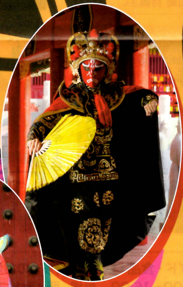
中国雙人変面ショー