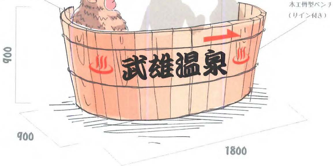
猿の立体造作オブジェ