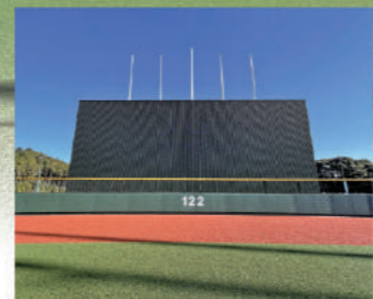
バックスクリーン