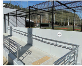
観覧席 (スロープ付)