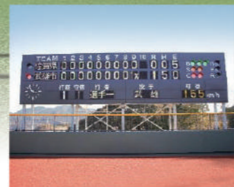
スコアボード (球速表示有)