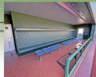
ベンチ (トイレ・ミストシャワー付)