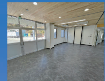
エントランス (会議室利用可)