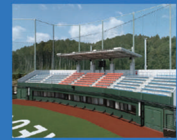
メインスタンド (観覧席)