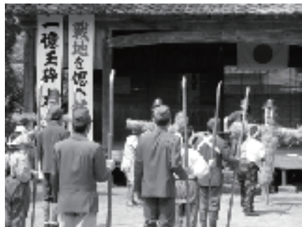
麦畑でのロケ風景（北方町永池） 淀姫神社もロケ地に（朝日町川上） 多数の市民エキストラが参加

※今回のドラマロケにつきましては、市内でのロケ期間中にフジテレビから製作発表がなされるという事情により、事前にお知らせできなかったこととお詫びいたします。なお、ドラマのタイトルは「千の風になって」ドラマスペシャル「はだしのゲン」です。