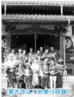
東光寺にてお参り体験