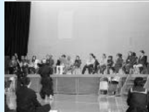
姉妹校である山内中学校にて 歓迎会