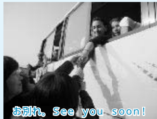
お別れ。See you soon!