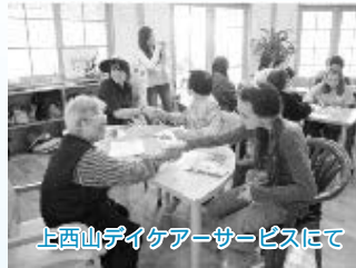
上西山ダイケアサービスにて