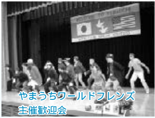
やまうちワールドフレンズ 主催歓迎会