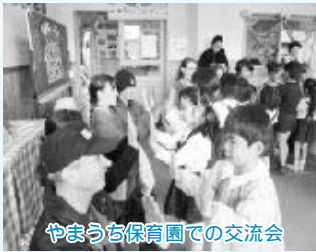
やまうち保育園での交流会