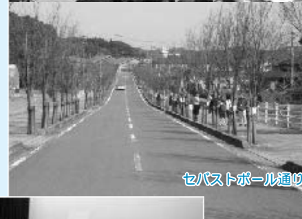
セバストポール通り