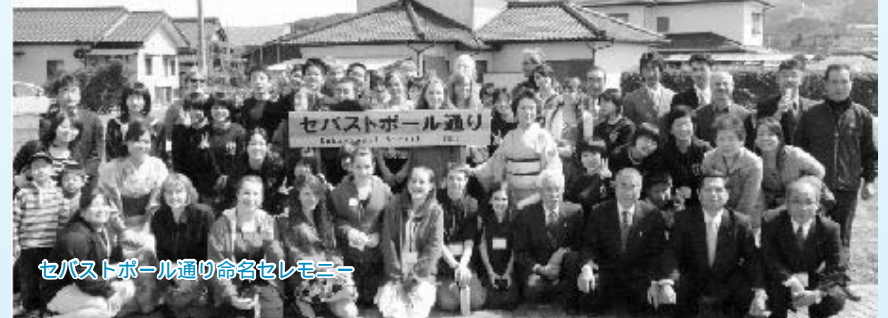
セバストポール通り命名セレモニー