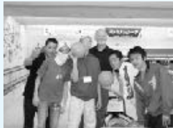
武雄ボーリングセンターからも ご招待を受けました