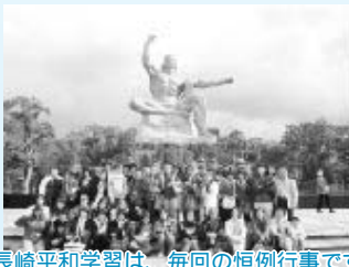
長崎平和学習は、毎回の恒例行事です