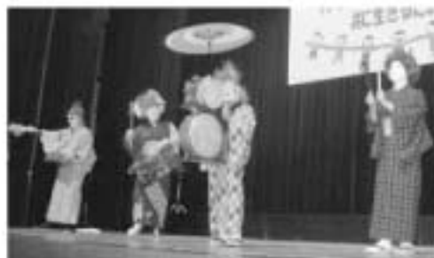
武内町チンドン隊の音さんによる男女共同参画寸劇

平成21年2月14日(土)、武雄市文化会館において、平成20年度武雄市男女共同参画啓発イベント「男女が良きパートナーとして生き生きと暮らすために」を開催しました。