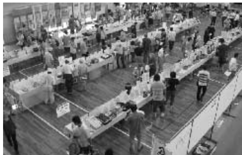
▲合同公売会の様子

● 公売財産の引渡しは、買受代金納付時の現況有姿で行います。 ※ 公売前に滞納の税が完納された場合などに公売中止となることもあります。