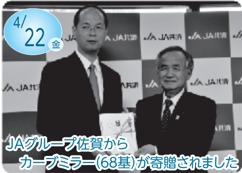
JAグループ佐賀から カーブミラー(68基)が寄贈されました

この度、前回の修理前の写真が新たに見つかったことから、写真を参考に修理前の本来の顔立ちに戻され、色もこれまでの白基調から黒基調へと全体的に塗り直されました。公開については貴明寺にお問合せください。