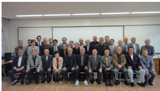
▲農業委員会は農業者や地域の声を行政・施策へ反映させます

農業委員会は、農業委員会等に関する法律に基づき、原則として市町村ごとに設置されている行政委員会です。選挙による委員30人と推薦による選任委員(農協、共済組合、土地改良区推薦各1人、議会推薦4人以内)で構成されます。農業委員会は主に、①農地行政の適正な執行(農地の売買、貸借、転用等)についての公正な審査 ②地域農業の構造改革の推進 ③地域の世話役活動と農業者の公的代表などといった役割を果たしています。