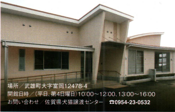
場所／武雄町大字富岡12478-4 開館日時／(平日、第4日曜日)10:00~12:00、13:00~16:00 お問い合わせ／佐賀県犬猫譲渡センター ☎0954-23-0532

動物愛護活動を通じた人々の交流拠点としても期待される当施設。武雄市の新たな顔になりそうです。