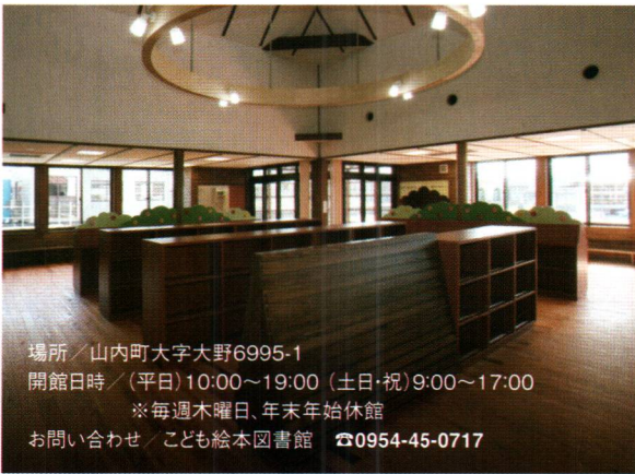
場所／山内町大字大野6995-1 開館日時／(平日)10:00~19:00 (土・祝)9:00~17:00 ※毎週木曜日、年末年始休館 お問い合わせ／こども絵本図書館 ☎0954-45-0717

4月1日に運営を開始する当施設は、正和福祉会が収蔵した様々な図書や、子どもから大人までどなたでも、無料で施設を利用できる、地域に根ざした施設です。 木の香りが心地良い「こども絵本図書館」を、ぜひご利用ください。