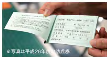
※写真は平成26年度助成券