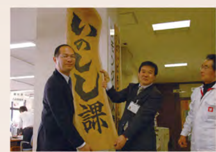
田畑を荒らす害獣を特産品化。いのしし課設置。 2009