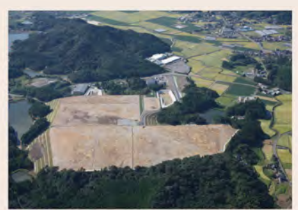
武雄北方インター工業団地完成。地域経済を活性化。 2011