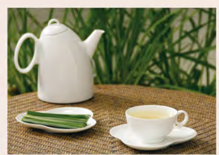
レモングラス試験栽培をスタート。新たな特産品へ。 2007