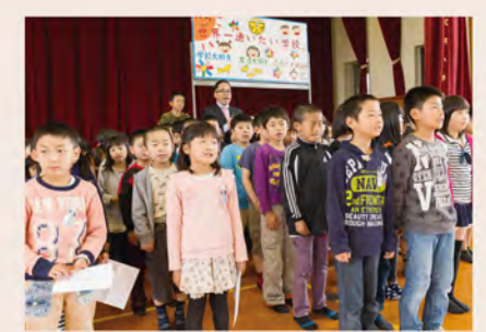
官民一体型学校「武雄花まる学園」開校。 2015