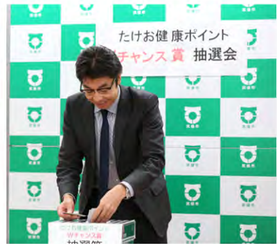
たけお健康ポイント Wチャンス賞 抽選会