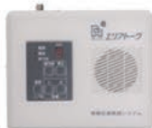
▲旧戸別受信機 （エアートーク）