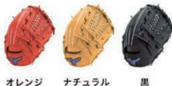
オレンジ ナチュラル 黒