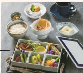
ビストロ エヴァン カドゥー

たくさんのハーブや食花を使い、見た目にも工夫しています。味と香りをお楽しみください。