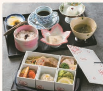
レストランまるいし

洋食一筋40年の経験に裏打ちされた、こだわりで仕上げられた欧風仕立ての鶏肉五膳。味も量も満足感で満たされます。