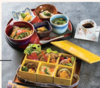
すし料理専門店 亀井鮓

色鮮やかな茶碗蒸しをはじめ、すし職人歴52年の技が光る五つの鶏料理。それぞれにダシが効いた奥深い旨みは絶品。