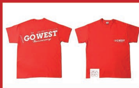
西九州新幹線「かもめ」1日乗り放題Tシャツきっぷ