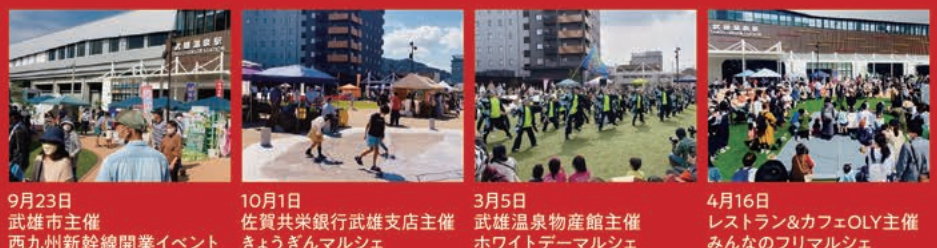
9月23日 武雄市主催 西九州新幹線開業イベント 10月1日 佐賀共栄銀行武雄支店主催 きょうぎんマルシェ 3月5日 武雄温泉物産館主催 ホワイトデーマルシェ 4月16日 レストラン&カフェOLY主催 みんなのフリマルシェ