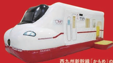
西九州新幹線「かもめ」のフワフワ

場所 — 武雄温泉駅南口駅前広場 内容 — ステージイベント、グルメコーナー、体験・ワークショップ 西九州新幹線「かもめ」のフワフワ など