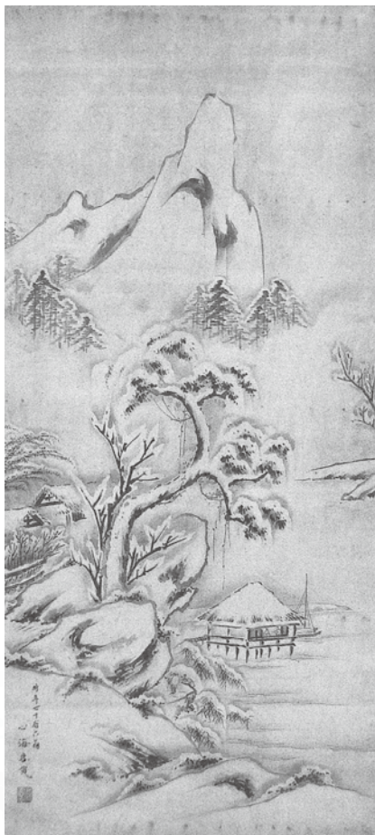
萩の尾茶屋雪景山水図 (心海良寛) 有田家コレクション