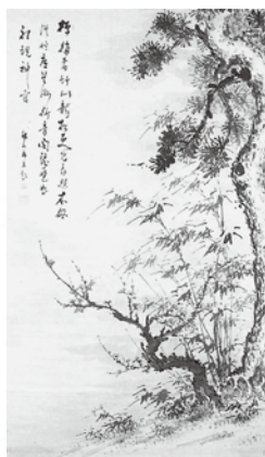
松竹梅図 (草場佩川) 有田家コレクション