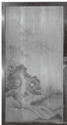
竹虎図杉戸板絵 (作者不詳)