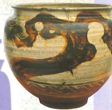
鉄絵緑彩岩松樹文甕 (個人)