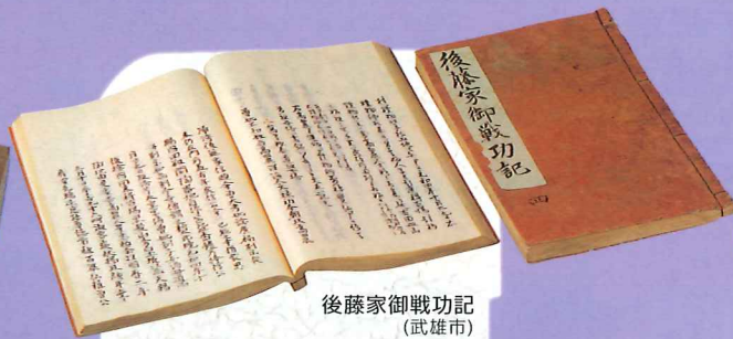
後藤家御戦功記 (武雄市)