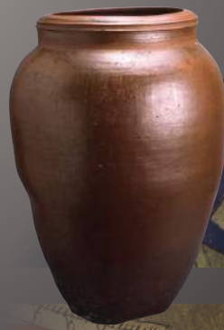
褐釉大甕「寛永六年」銘 (佐賀県立九州陶磁文化館)