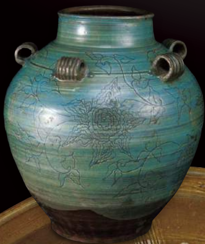
緑釉唐花唐草文五耳壺(個人蔵)