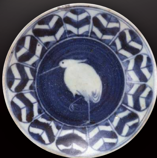
染付 鷺羽根文皿 (佐賀県立九州陶磁文化館/柴田夫妻コレクション)