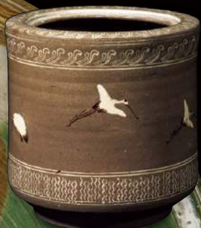
象嵌鶴文水指(個人蔵)