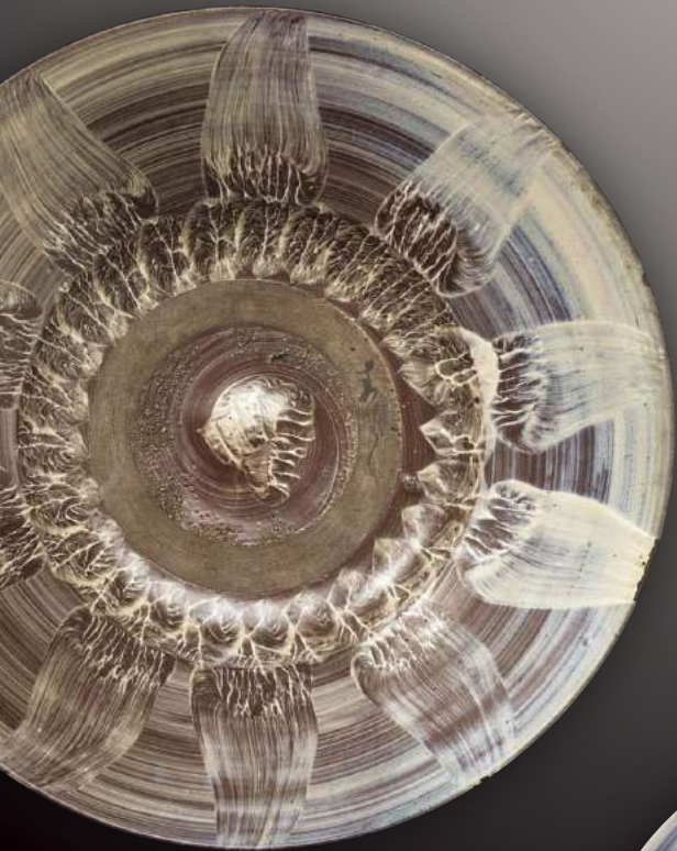
打ち刷毛目花文大平鉢(個人蔵)