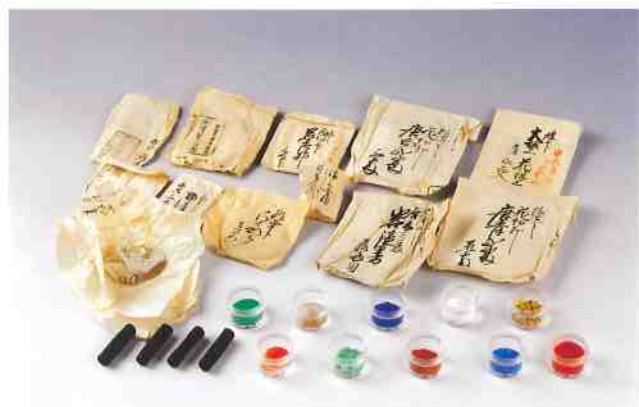
■ 茂義公皆春齋御絵具