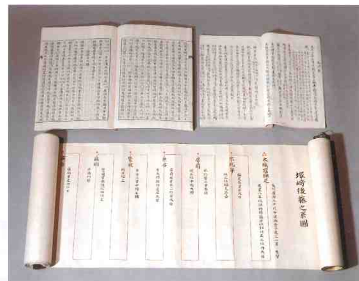
■ 藤山考略・塚崎後藤之系図