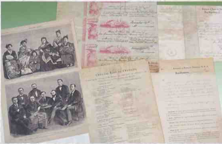
▲岩倉米欧使節 紹介状ほか (武雄市)