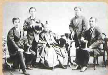
▲サンフランシスコで撮影の岩倉一行写真