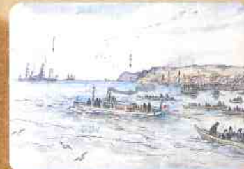
▲岩倉大使米欧派遣横浜港 (原資料: 宮内庁)