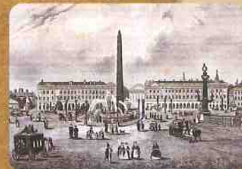
▲『米欧回覧実記』からパリ・コンコルド広場