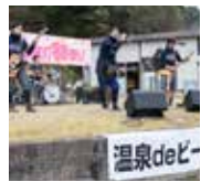
8日、9日 温泉deビートルズ