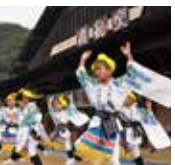
8日 武内保育園荒踊り