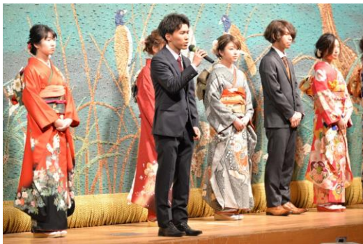
【実行委員会による成人式】

1月3日の成人式には、新成人587名が集い、実行委員の運営で盛大に開催することができました。