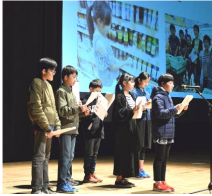
【トムソーヤフェスティバル】

2月16日開催の「第14回トムソーヤフェスティバル」では、子どもたちが学校や地域での活動を元気に発表してくれました。