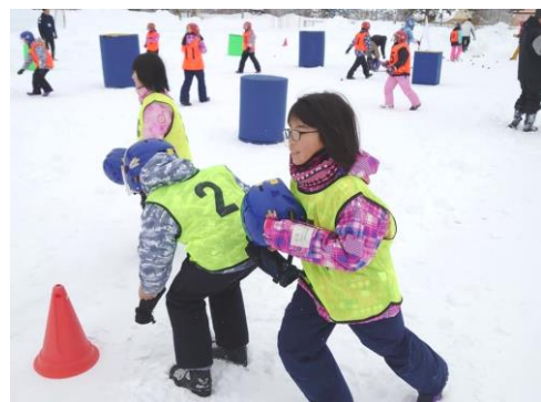
【北海道雄武町との児童交流】

青少年教育では、1月31日から2月4日までの5日間にわたる「北海道雄武町の児童交流」では、子どもたちは厳しい寒さを体験し、ホームステイを通じて交流を深めてまいりました。