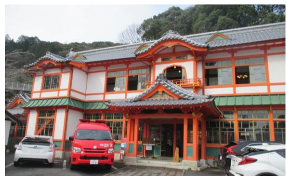
【文化財防火デー火災防御訓練】

文化財関係では、文化財防火デーにあたる1月26日に武雄温泉楼門周辺での文化財火災防御訓練を実施し、文化財を火災から守るとともに、市街地における大規模な火災に備え、消防団及び地域の皆様と協力して、避難訓練等に取り組みました。