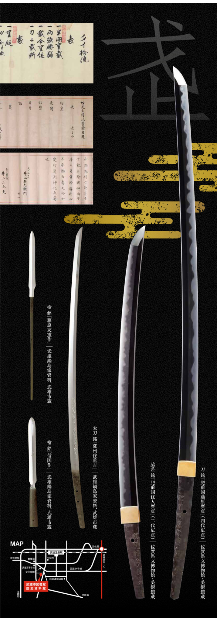
槍銘「藤原友重作」武雄鍋島家資料、武雄市蔵