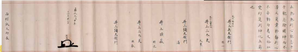
初公開 「妙見自得流管槍目録」武雄市蔵