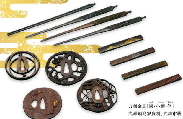
刀剣金具「鐔・小柄・笄」 武雄鍋島家資料、武雄市蔵