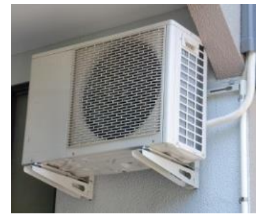
エアコン室外機の壁掛け