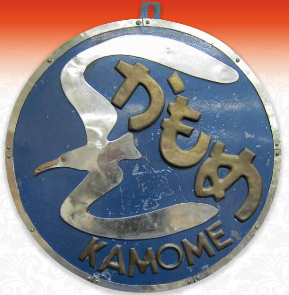
特急「かもめ」ヘッドマーク | 京都鉄道博物館蔵