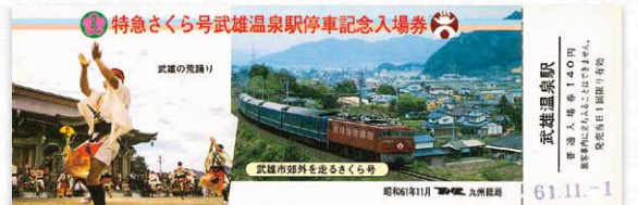
記念切符 | 個人蔵