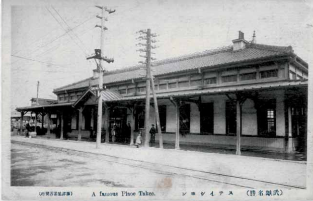
旧武雄駅舎絵葉書

明治28(1895)年5月5日、佐賀～武雄間の鉄道が開通、武雄駅が誕生しました。古くから湯治場として多くの人々を集めた武雄は、以後、遠来の客が集まる観光地として新たな出発となりました。昭和50(1975)年には駅名が「武雄温泉」に改称され、西九州地域の観光を支える拠点駅として役割を果たしてきました。