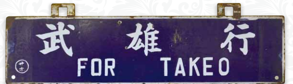
行き先表示版(サボ)「武雄行」 | 個人蔵