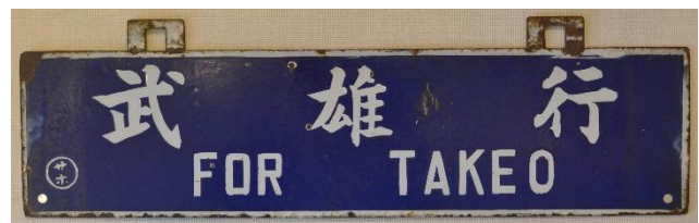
行先表示板（サボ） 個人蔵