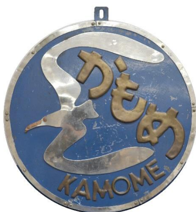
特急「かもめ」ヘッドマーク 京都鉄道博物館蔵