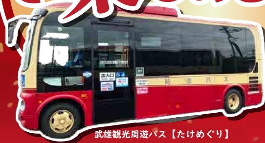
武雄観光周遊バス【たけめぐり】