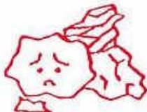
再生のきかない紙くず