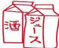
アルミニウムが使ってあるバック類