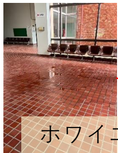
ホワイエの雨漏り