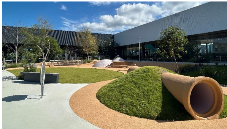
施設内調整池（民間企業）