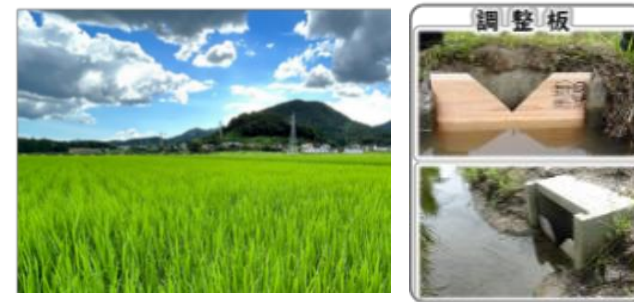
田んぼダム（農業者）