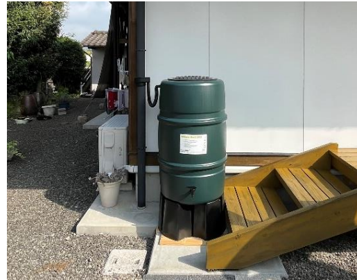
雨水貯留タンク（地域住民）