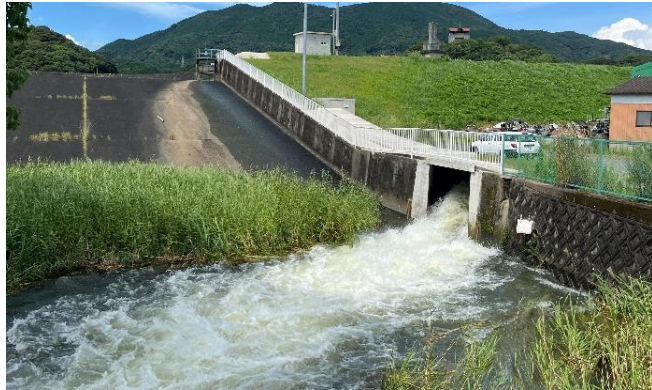
ため池事前放流（ため池管理者）