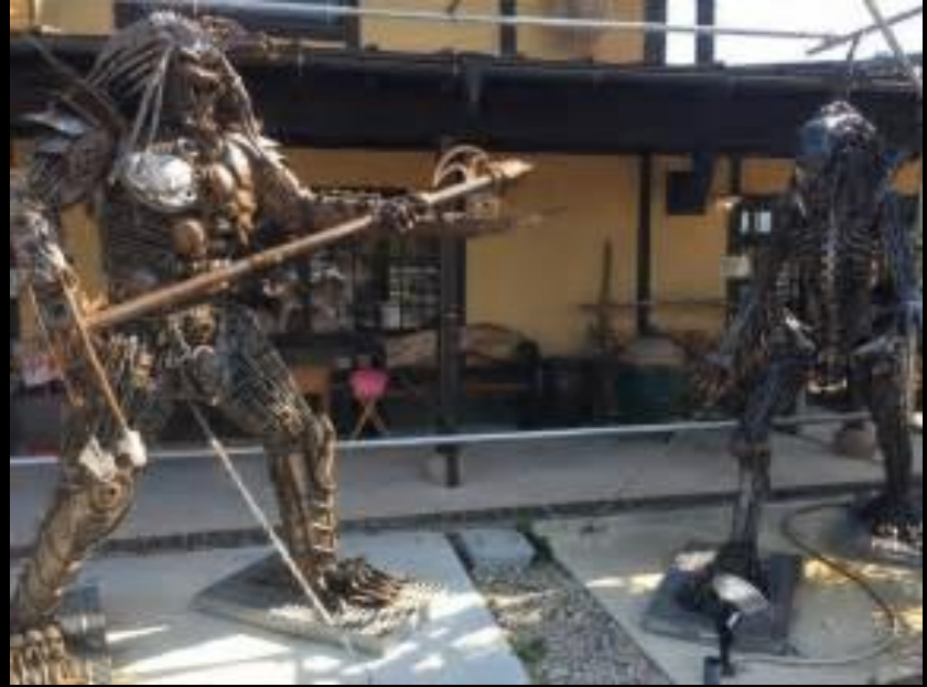
↑ エイリアンとプレデター