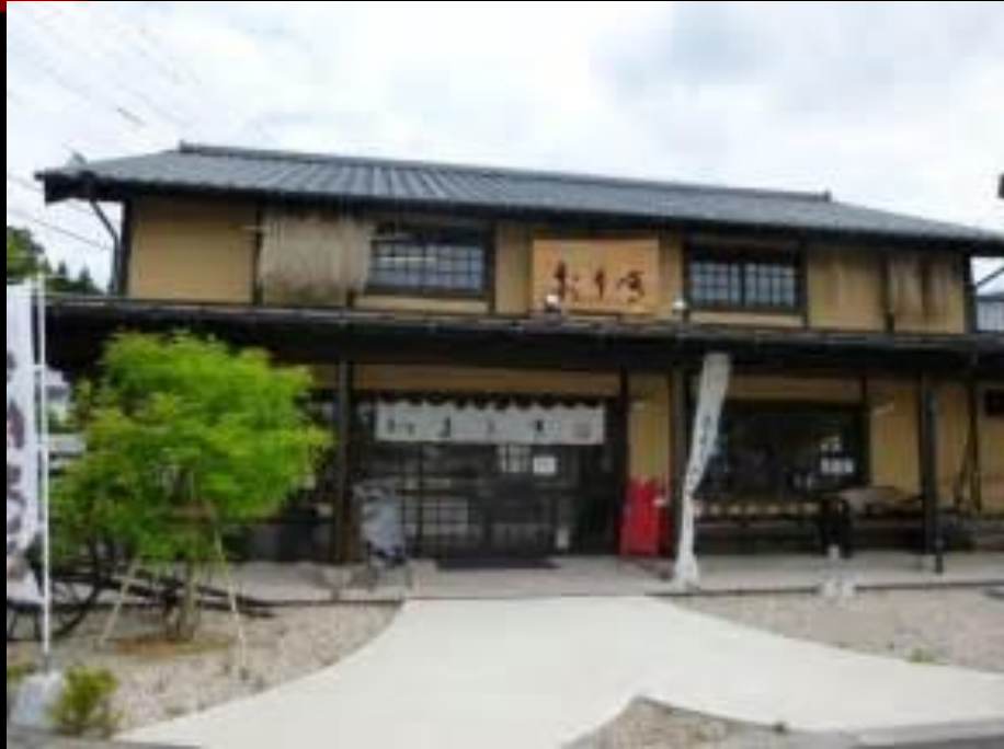
おりき (まんじゅう)