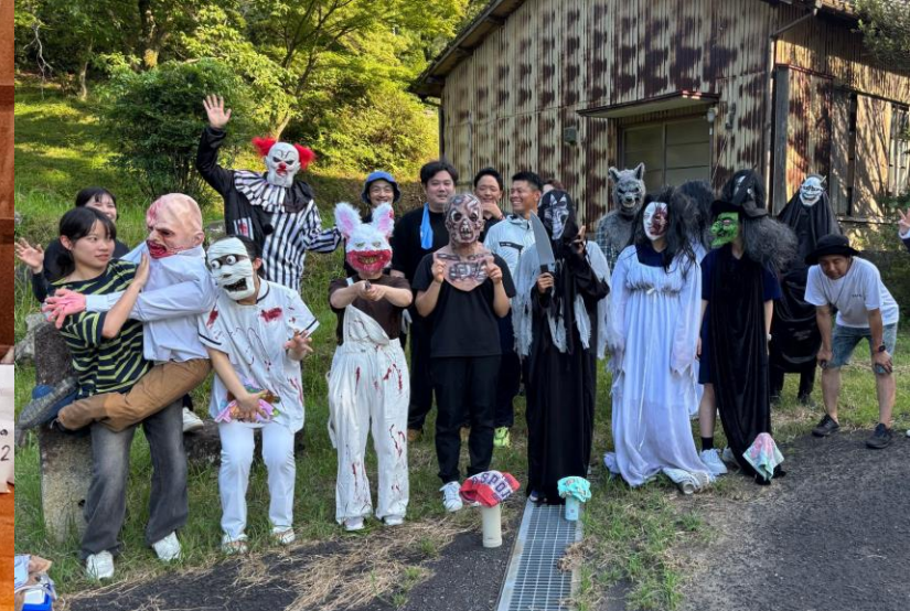
【特別研修】 武内町きもだめし～おばけの森リターンズ