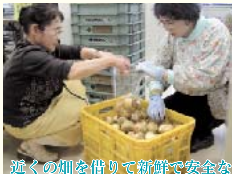
近くの畑を借りて新鮮で安全なお野菜も作っています。

よかまち武雄をつくる人々コーナーで紹介させていただく方々、団体を募集しています！市役所の秘書広報課までご連絡ください！！