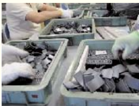
仕事の委託を受け作業をしている様子