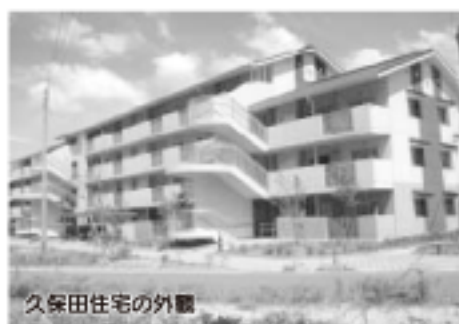
久保田住宅の外観

まちづくり部 建設課 (23)9330 山内支所まちづくり課 (45)2909 北方支所まちづくり課 (36)6023