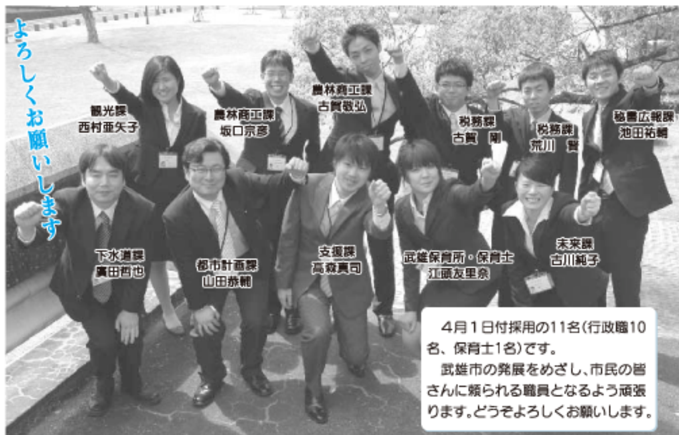
4月1日付採用の11名(行政職10名、保育士1名)です。 武雄市の発展をめざし、市民の皆さんに頼られる職員となるよう頑張ります。どうぞよろしくお願いします。