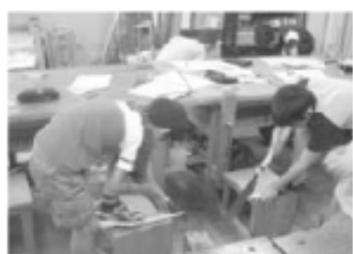
水鉄砲作りにチャレンジ！物の大切さを学び、自分だけの作品を作りました。