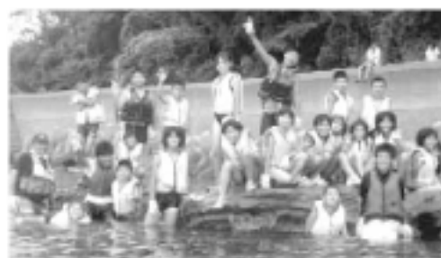
昨年の青島キャンプの様子です。自然の中で、みんなと協力し楽しいキャンプを体験しました。