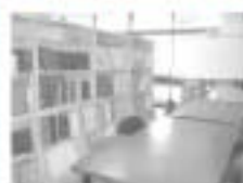
情報公開コーナー (市役所3階)

※行政資料閲覧コーナー、建設課での閲覧は、平日の8時30分から17時まで。市ホームページはいつでもご覧になれます。