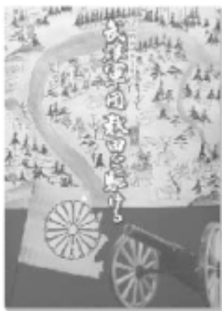
「戊辰戦争一四〇年武雄軍団秋田を駆ける」 価格：1,000円

歴史資料館では、戊辰戦争一四〇年という節目の年に、図録「戊辰戦争一四〇年武雄軍団秋田を駆ける」を発行いたしました。図録では、武雄に残された関係資料とともに、秋田・山形県内からも資料写真