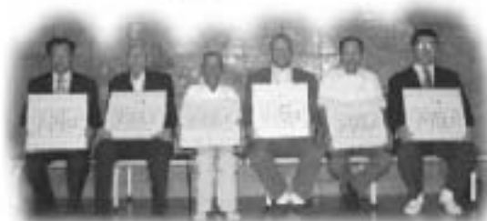
▲平成21年度体育功労者のみなさん