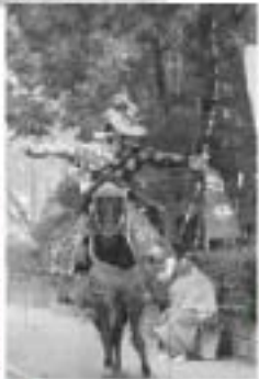
黒髪神社の流鏝馬