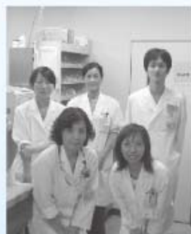
▲薬剤科スタッフ (薬剤師4名、事務1名)

☆症状がよくなっても自分の判断で薬をやめないでください。急に薬をやめると、治療の妨げになるばかりか、反動から症状が悪化し危険な場合があります。のみ忘れが多いときも正確にそのことをお知らせください。医師が薬の効果を、判断します。☆残った薬を処方期間を過ぎてのんだり、人にあげたりしないでください。