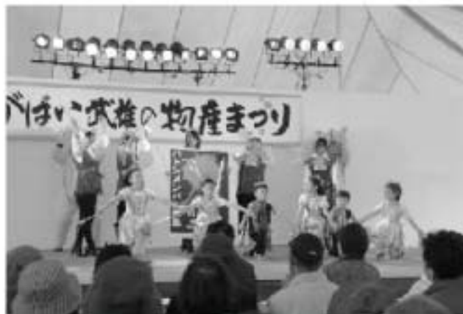
▲昨年の様子です。多くのお客さんと関わりました。