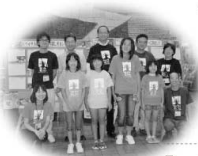
▲受賞者の皆さんと市長、環境課の皆さんです

これは、8月に実施したプラスチックリサイクルツアー、紙すき体験学習会へ参加した小学生による感想文のうち、優秀作品を表彰したものです。 今回の表彰受賞者は次のとおりです。