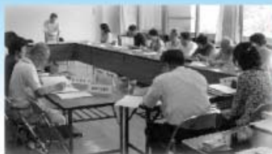
がん撲滅推進市民大会実行委員会