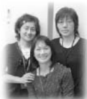
私たちが担当しています!