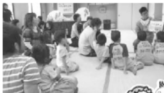
10月4日やまうちラブソーズ主催により「さざんかフェスタ」が開催されました。読み聞かせにはお父さんも参加、楽しい会になりました。