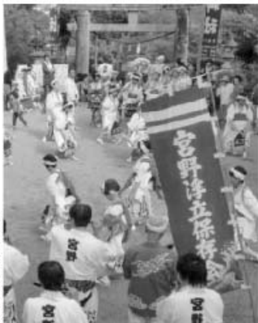
山内町宮野区の浮立