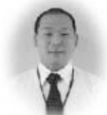
担当：通山（市民協働課）