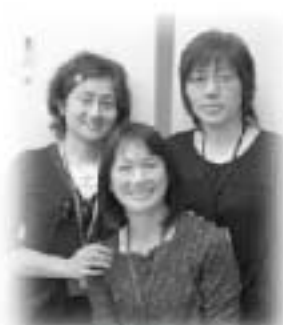
私たちが担当しています!