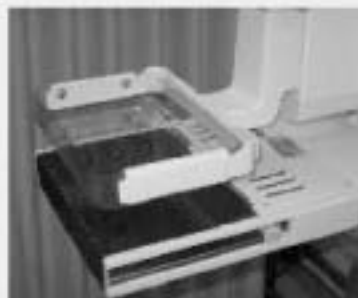
マンモグラフィー

◇日時 12月10日(木) 受付8時30分から10時30分 (受付後すぐ検診を開始します。子宮がん検診のみ10時30分から検診を開始します。)