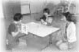
▲障がい児通園事業を行う「たんぼぼ教室」