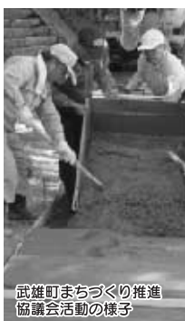
武雄町まちづくり推進協議会活動の様子