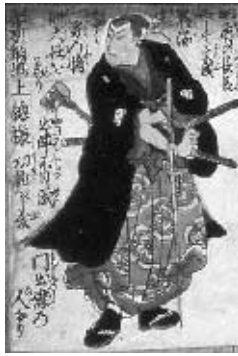
▶錦絵 「百軍忠勇千人之内」より

◇日時 7月17日(土)～8月29日(日)9時～17時 ※休館日は、毎週月曜日・第3木曜日(ただし月曜日が祝日の場合は、その翌日) ◇場所 武雄市図書館・歴史資料館