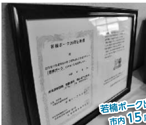
若楠ポーク出荷証明書 市内15店舗に発行 (平成23年2月28日現在)

武雄市新幹線活用プロジェクトでは、新幹線と地元特産品を活かした武雄市のPR活動に取り組んでいきます。今回は、「若楠ポーク」です。メニューに若楠ポーク取り入れている店舗に佐賀県農業協同組合と共同で、「若楠ポーク出荷証明書」を発行、店舗内に掲示して市民のみなさんへPRしていきます。